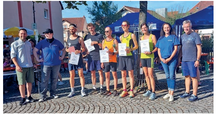
Friedenslauf 2024, SiegerInnen 20 km Lauf

In diesem Jahr feiern wir außerdem ein bemerkenswertes Jubiläum: 75 Jahre Grundgesetz. Unser Grundgesetz bildet das Fundament unserer Demokratie und garantiert die Würde eines jeden Menschen. Es verpflichtet uns, die Werte von Freiheit, Gleichheit und Menschlichkeit zu bewahren und zu verteidigen – gerade in Zeiten, in denen diese Werte weltweit herausgefordert werden.