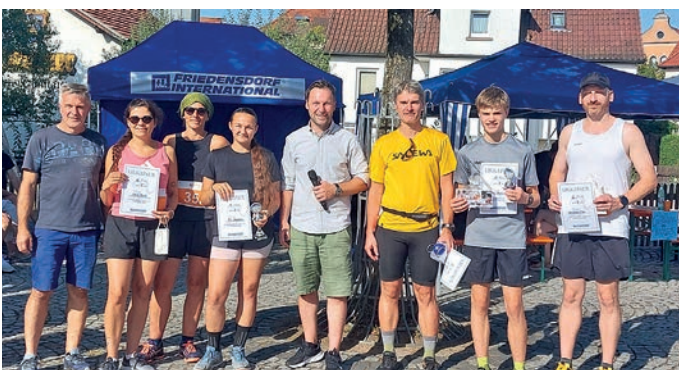
Friedenslauf 2024, SiegerInnen 5 km Lauf

Nach langer Pause fand mit dem 14. Friedenslauf des FRIEDENSDORF INTERNATIONAL in diesem Jahr wieder ein herausragendes Ereignis statt, das alle Bevölkerungsgruppen miteinander verbindet und im Zeichen des Sports eine klare Botschaft gegen Gewalt, Krieg und Diskriminierung sendet. Sporttreibende aller gesellschaftlichen Gruppen und Altersschichten, ob Profisportler oder Hobbyläufer, setzen mit der Teilnahme am 14. Friedenslauf ein starkes Zeichen für Frieden. Um diesen Gedanken noch zu untermauern, freut es mich sehr, dass wir als Marktgemeinde die Aktionsgruppe mit einem Friedensfest unterstützen konnten. Denn auch der Markt Schöllkrippen steht mit einer klaren Haltung für den Friedensgedanken.