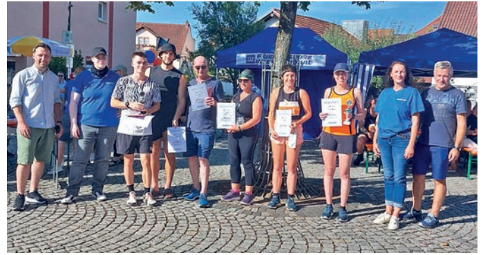
Friedenslauf 2024, SiegerInnen 10 km Lauf